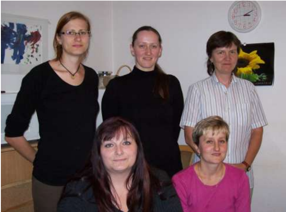
tým pečovatelské služby Vinohrady-Vršovice