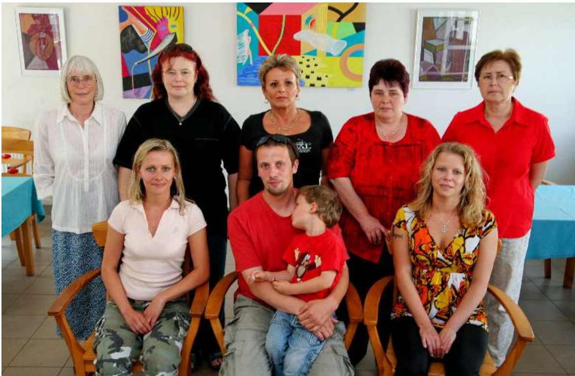
tým pečovatelské služby Dáblice